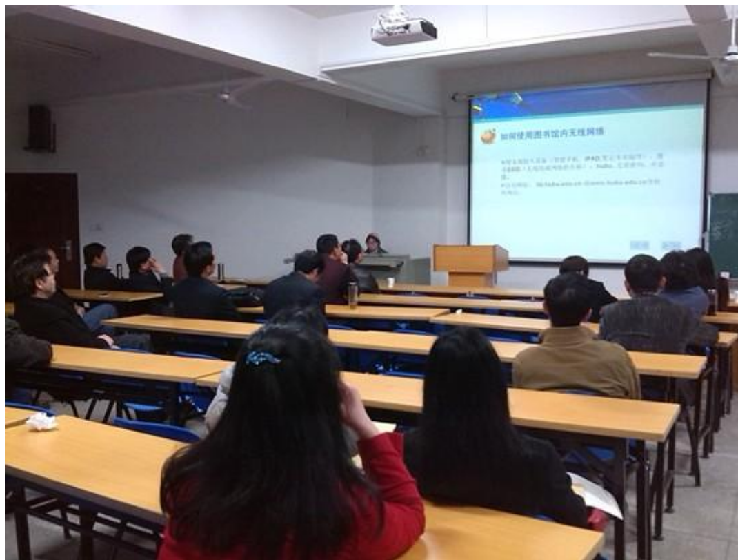
文学院教师专场培训