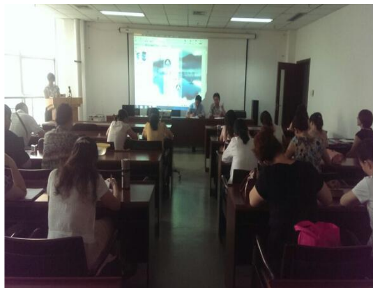
图书馆员工进行电子资源的相关培训