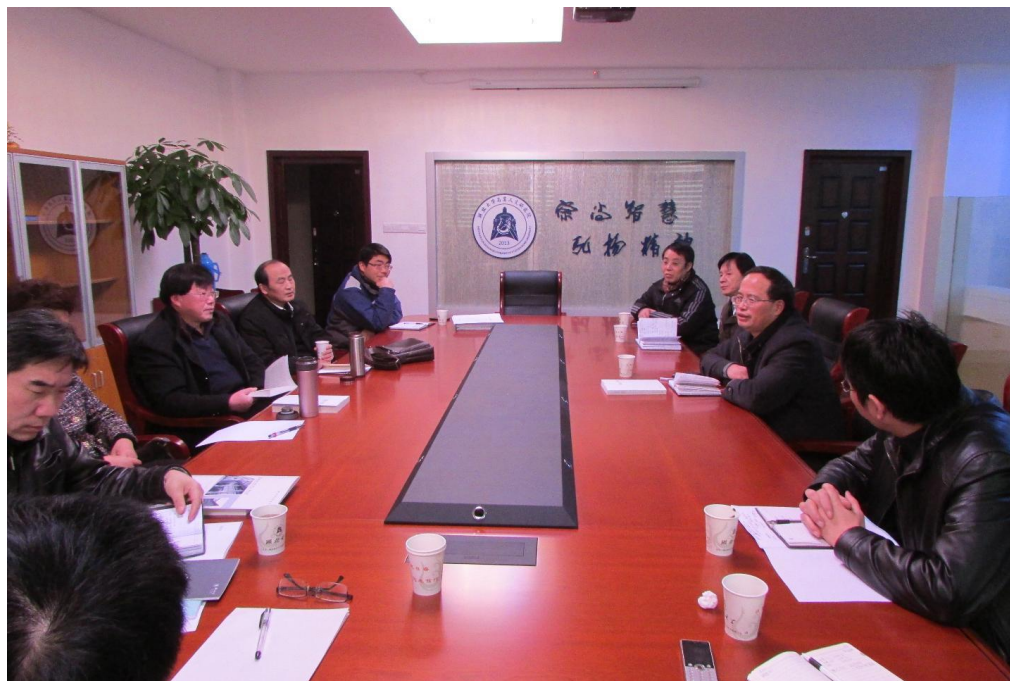
参加课题组讨论会