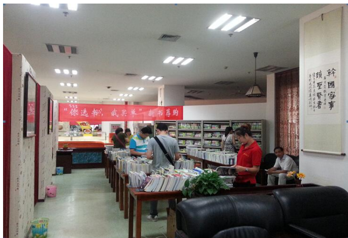
图书馆举行现场中文图书荐购会