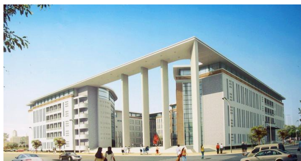
人文分馆藏 逸夫楼C座5、6楼