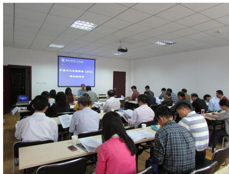
中国文化发展报告蓝皮书项目组会议