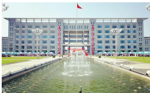
通识教育学院分馆 教学楼6楼