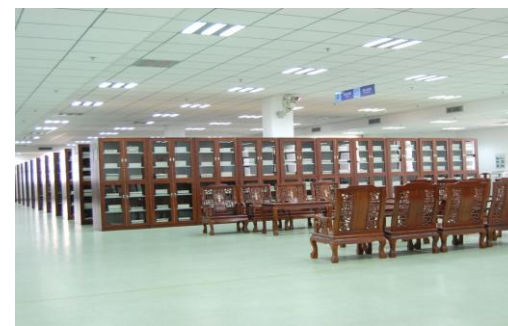
总馆12楼特藏阅览室