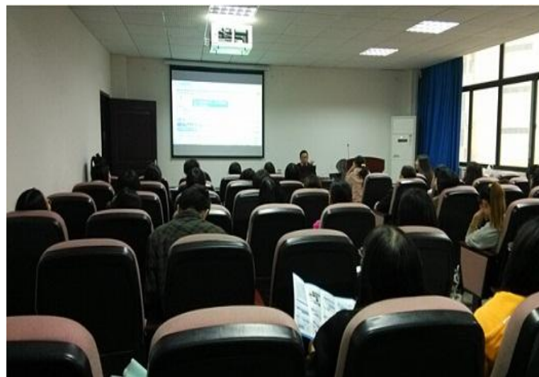
邀请中国知网为院系老师做培训